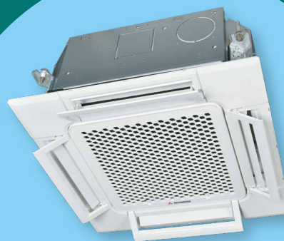
FDTC Deckenkassette Die Deckenkassette im Euroraster zum Heizen und Kühlen ist mit einem Komfortpaneel ausgestattet.