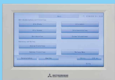
Zentralfernbedienung SC-SL4-AE Die 9" große Touchscreen-Zentralfernbedienung ist für die Einzel-, Gruppen- und Zonensteuerung von bis zu 128 Geräten geeignet.

Das Komfortpaneel führt die Luft entlang der Decke und sorgt so für eine komfortablere Verteilung.