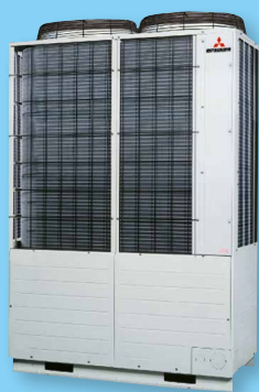
FDC 680 KXE6 Klima-Außengerät Die wartungsarmen KX-Außengeräte von Mitsubishi Heavy Industries für 2-Leiter-Systeme bringen große Leistung auf kleiner Stellfläche.

Die KX-Serie lässt in puncto Komfort, Behaglichkeit und Energieeffizienz keine Wünsche offen. Innen- und Außengeräte können nahezu unbegrenzt miteinander kombiniert und zentral oder dezentral gesteuert und überwacht werden.